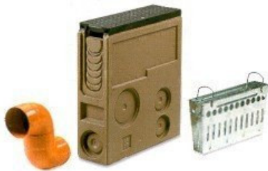
GERUCHSVERSCHLUSS - SCHACHT - SAMMELTOPF