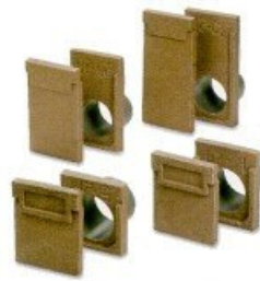
SCHACHTKOPF - RACCORDO